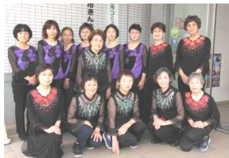
6 月 18 日撮影