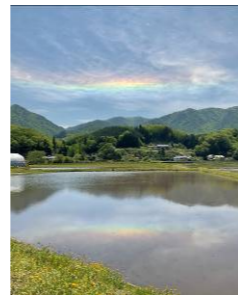
かんすいへい 環水平アーチ (上川西)