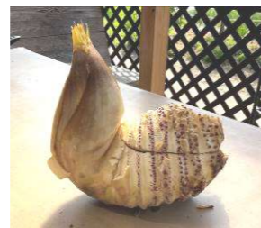
オブジェのような筍 (小用町 林晋吾さん宅)