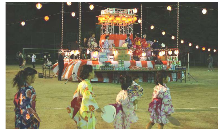
輪になって踊る参加者の皆さん