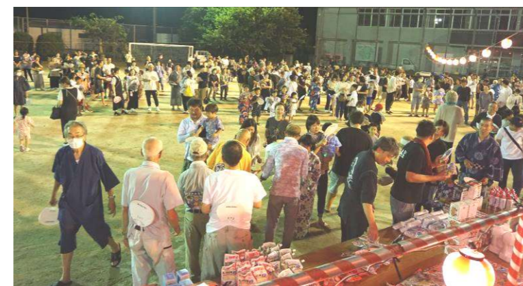
うちわ富くじで一喜一憂