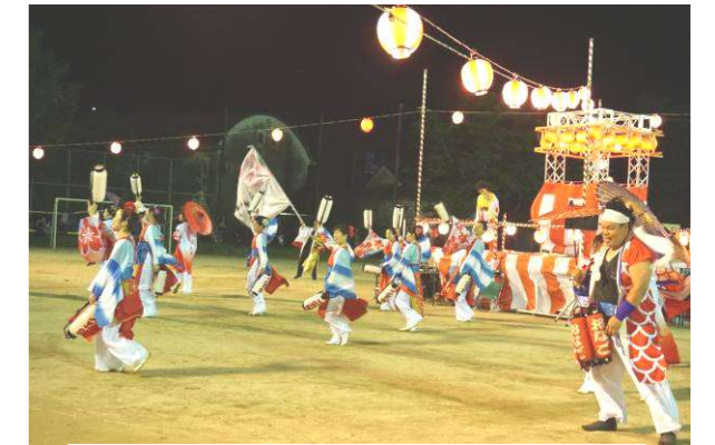
おなご乱舞連が見事な舞を披露