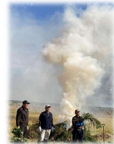
↑ センター狼煙上げの様子