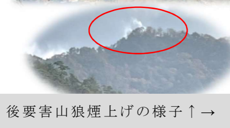
後要害山狼煙上げの様子 ↑ →

下山後は、センター駐車場にて暖かい豚汁がふるまわれ、“青空食堂”で大いに賑わい、好天とコロナ対応の緩和のなか、久々に満面の笑顔が溢れる楽しい一日となりました。