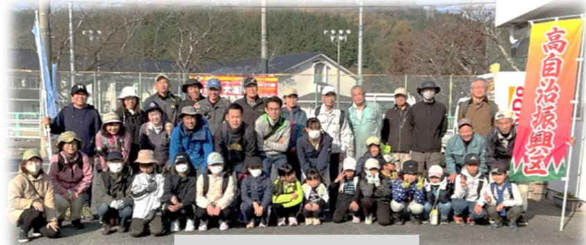
↑ 出発前の集合写真

高保育所園児からご高齢の方まで、老若男女総勢40名が9時30分に自治振興センターに集結し、出発式の後、後要害山・前要害山・センター横の田んぼの3か所の担当に分かれ、いざ狼煙上げに向かいました。